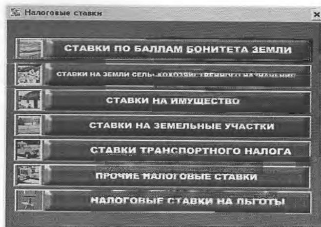
Рис. 5. Окно подпрограммы «Налоговые ставки»

При введении в информационную систему этого дополнительного программного модуля изменяемых ставок налогов, расчет имущественного, земельного и транспортного налога и выдача всех необходимых документов, таких как платежное извещение, справка об уплате налогов, расчет пени за несвоевременную уплату налогов и т.д., может производиться непосредственно при обращении к конкретному лицевому счету. Информация о налогах формируется в специальных налоговых лицевых счетах.